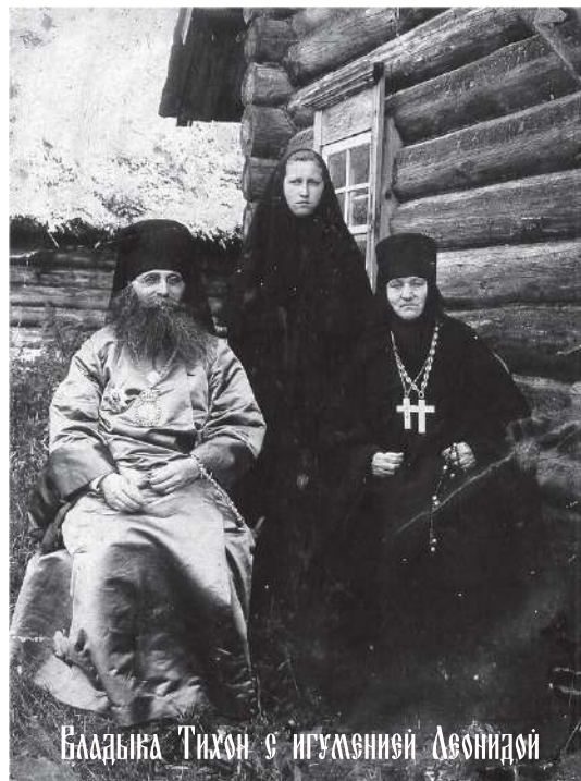
Блаженный Тихон с игуменией Леонидой

8 июля 1893 года епископ Митрофан (Невский) освятил